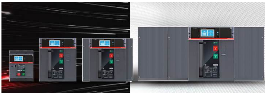
ABB SACE EMAX2

6. - 15% de tempo para efetuar a instalação.